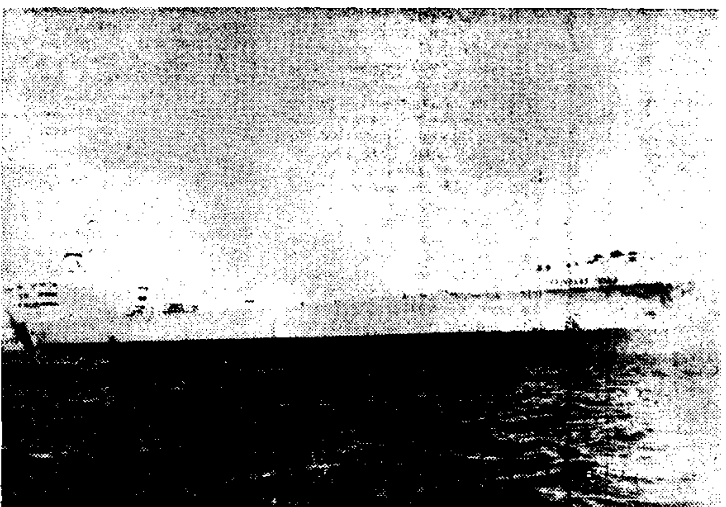
Εξθυμα και σοδαρά