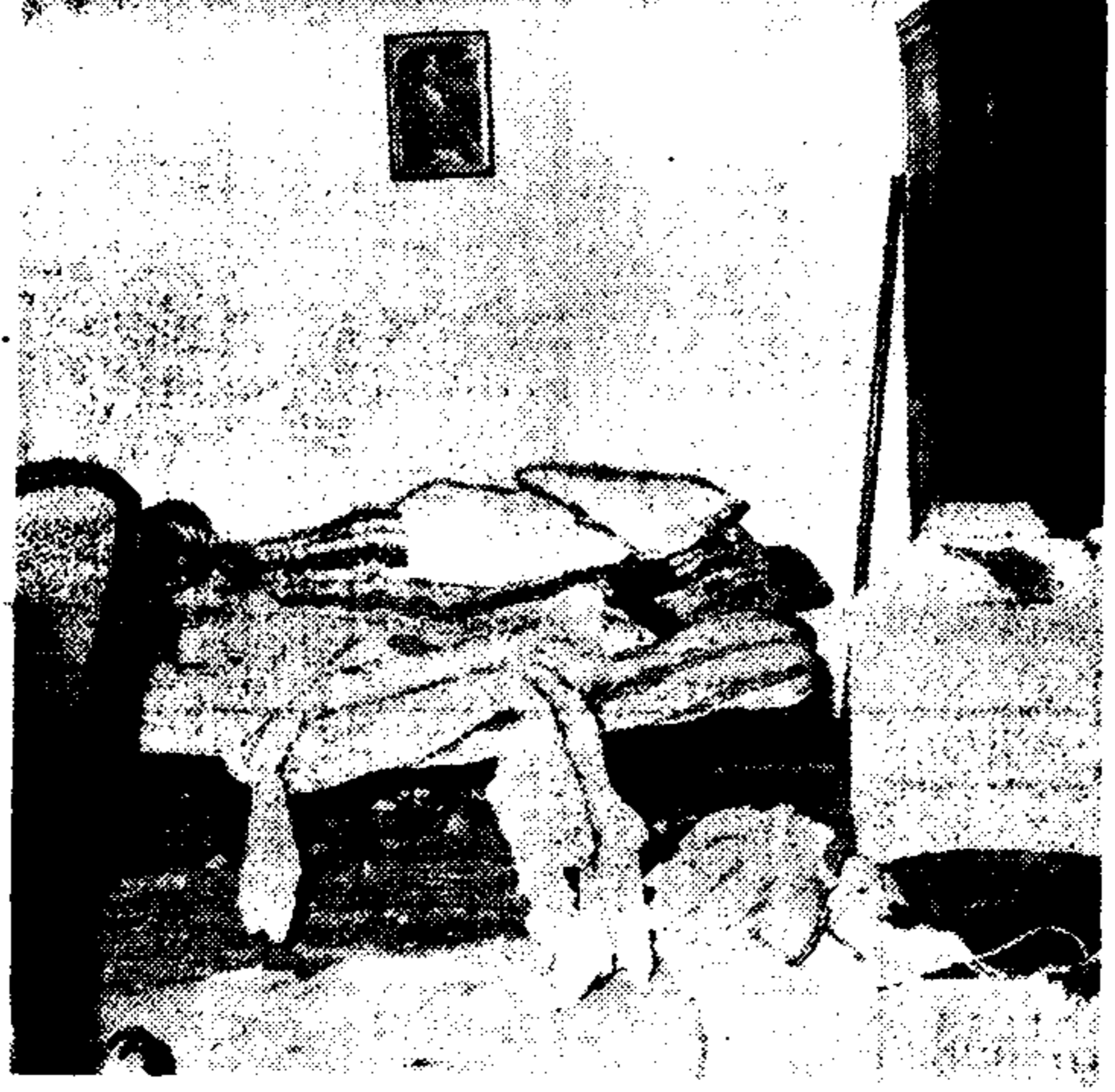
Μέσα σ' αυτό τό δωμάτιο ζούσε και δολοφονήθηκε ή Ιωάννα Νικήτα...