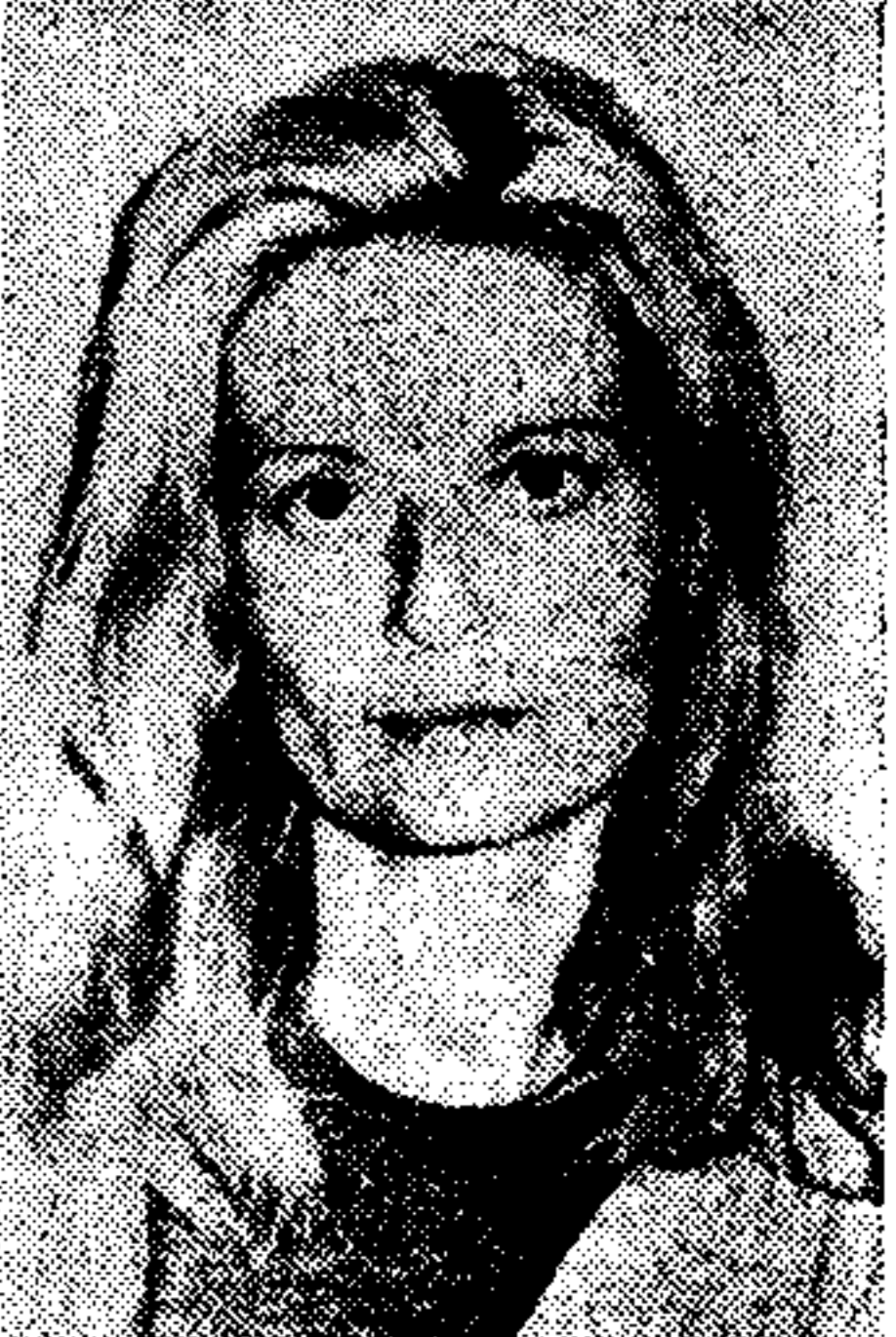
Άλωνα Καβίλια ή Μπρίφα